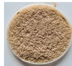
Po 10 minutach