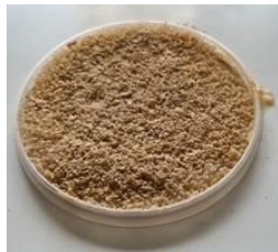
Po 5 minutach